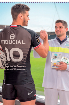
Romain Ntamack, ambassadeur des produits Sud de France