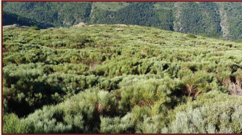
Lande à genêt purgatif très fermée. Le retour de l'herbe sera long et les rejets difficiles à contrôler après ouverture.

Le temps entre 2 interventions se raisonne, selon la dynamique de végétation et sa gestion. Plus on attend, plus l'impact sur le milieu, les coûts de réalisation sont importants et la réponse pastorale est longue.