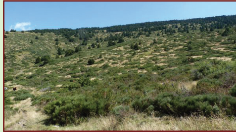
Lande à genêt purgatif fermée, avec encore de l'herbe. Il est encore temps d'intervenir mais il ne faut pas tarder !