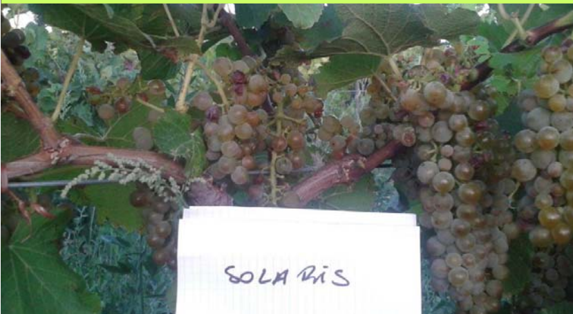
Illustration 3 : SOLARIS